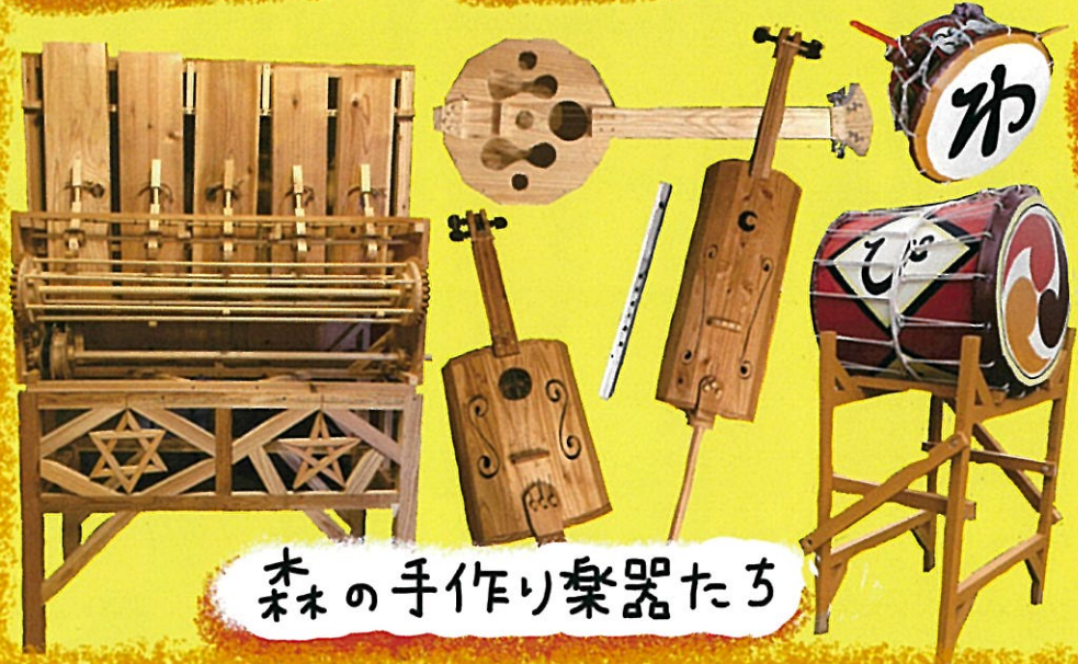
木の手作り楽器たち