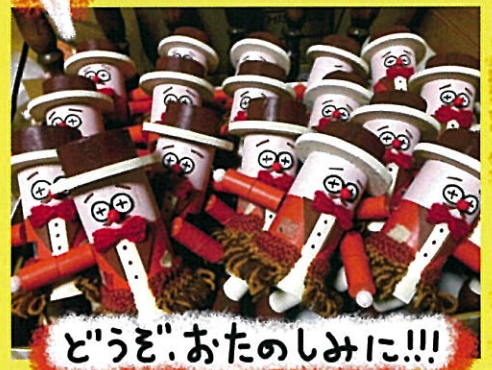
どうぞ、おたのしみに!!!